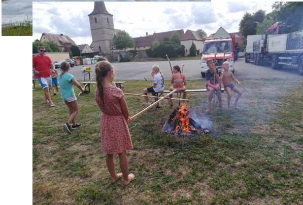
Zielen, Treffen, Rutschen mit der FFW Unternbibert