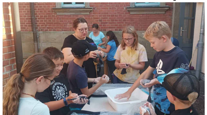
Filzen am Lagerfeuer mit dem KiGo-Team