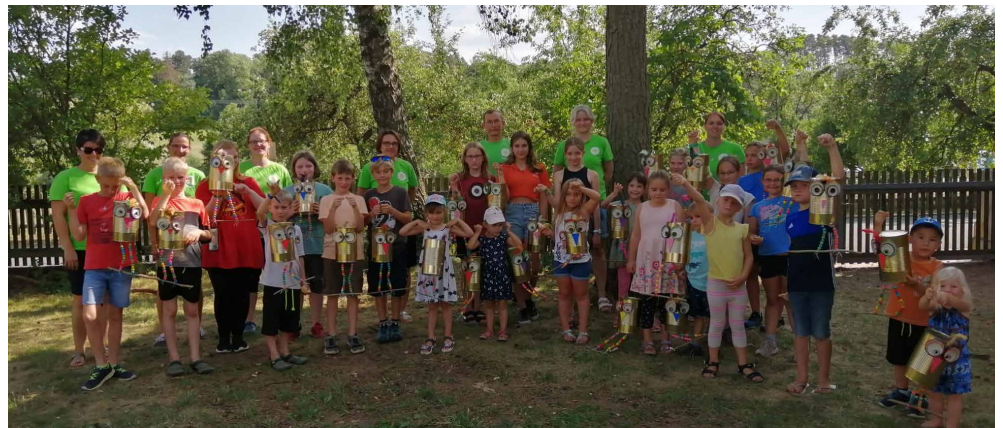
Schrottielen basteln mit dem OGV Unternbibert