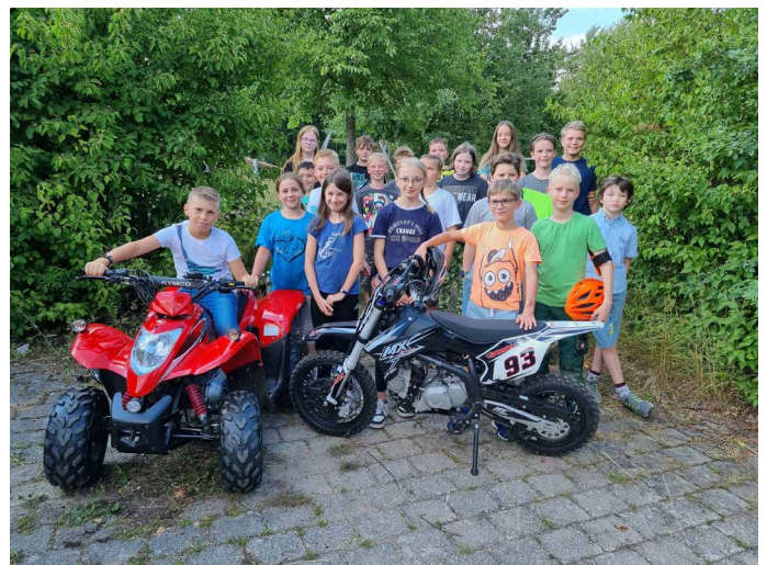
Quadfahren mit dem MC Rügland