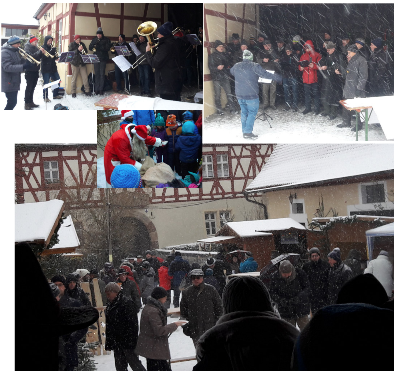
Rügländer Weihnachtsmarkt 2017