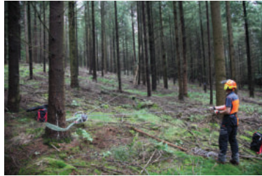
Ein sichere Alternative, wenn das Holz stimmt: Mit einer Spillwinde können hängen gebliebene Bäume unverzüglich und fachgerecht zu Fall gebracht werden.

Wenn geeignete Maschinen und Werkzeuge fehlen, werden solche „Hänger“ häufig erst viel später endgültig zu Fall gebracht. Oft wird der Gefahrenbereich in dieser Zwischenzeit nicht einmal abgesperrt und gekennzeichnet. Wer hier abwartet oder mit den falschen Arbeitsmitteln und ohne Fachkunde agiert, riskiert Leib und Leben.